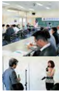
祭文化祭に参加計画(とも)に6月)文化祭ではカフェ出店を計画。

平成26年度の役員会は14日(土)に小田原市民会館会議室で開催されました。議題は7日(土)のバス旅行の報告、体育祭と文化祭の参加と同窓会カフェの打ち合わせが確認されました。続いて、第3号となる会報の進捗が報告され、第2号と同じレイアウトで編集していくことと協賛金の方向性が報告されました。合わせて、第2号発行による会費納入、寄付入金金の報告が会計からありました。 平成26年9月度 9月度の役員会は13日(土)に西湘高校で開催されました。